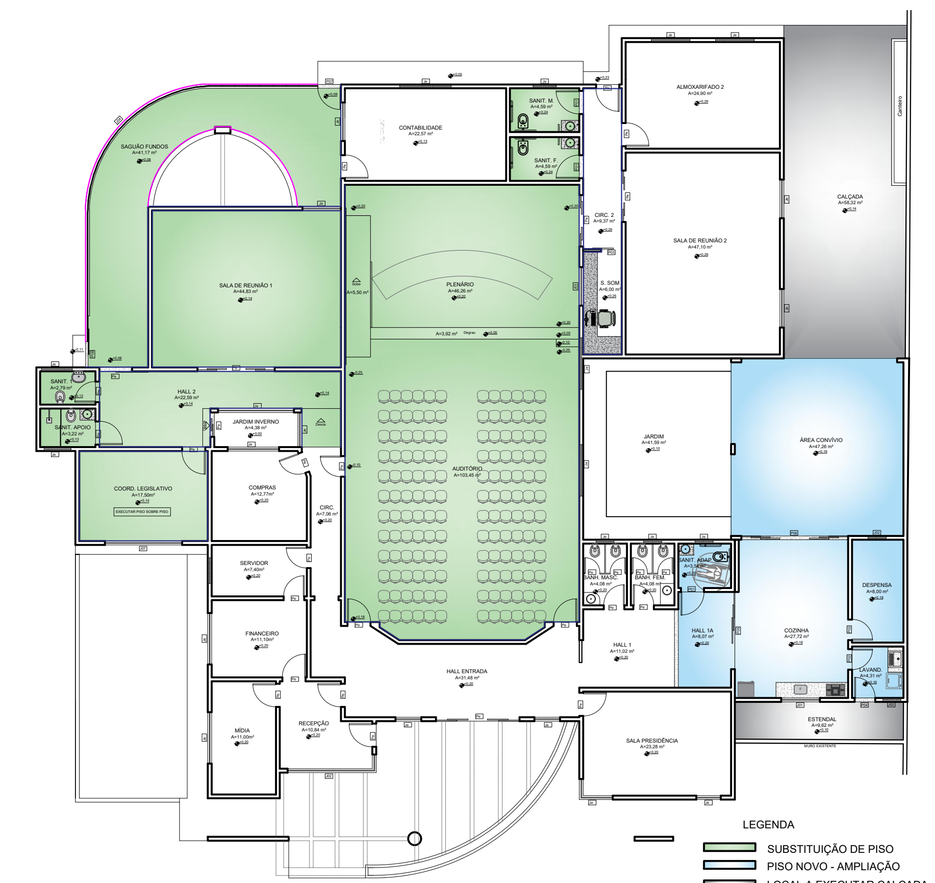
PLANTA INTERVENÇÃO - PISOS ESC. 1:150